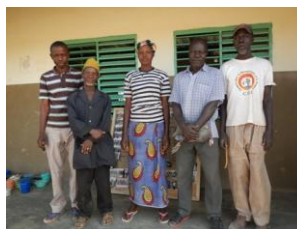
Les représentants des parents d'élèves