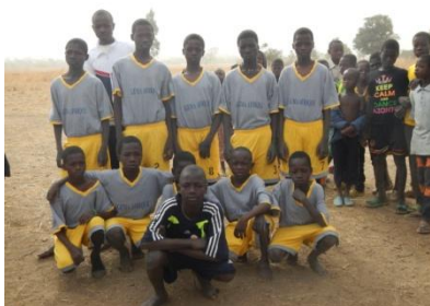
L'équipe de foot de l'école de Mangagou

Elles en ont profité pour visiter d'autres écoles et ont eu même l'occasion d'assister à un match de foot inter-école. Chaque séjour, très riche en échanges avec les burkinabés, nous permet de connaître un peu mieux leur culture et de nouer des relations de confiance. Dans les mois qui viennent, d'autres séjours sont prévus par différents membres du conseil d'administration.