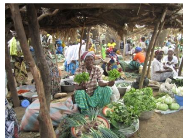
Le marché de Zabré