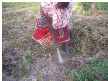
La récolte des arachides