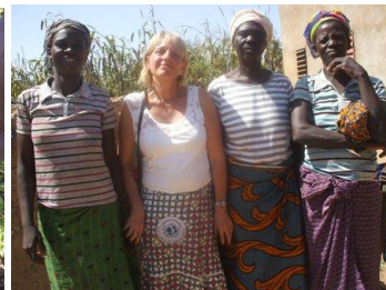
les 3 femmes de la maison