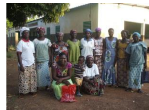
Les femmes de l'association Myasoukum