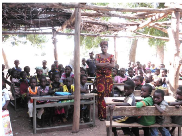
Elèves dans la classe sous paille

Ce bâtiment a été construit pour un coût de 20 000 €. Il permet d'accueillir 65 élèves en moyenne par classe et comprend aussi un bureau pour le directeur.