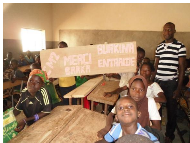
Elèves dans leur nouvelle classe